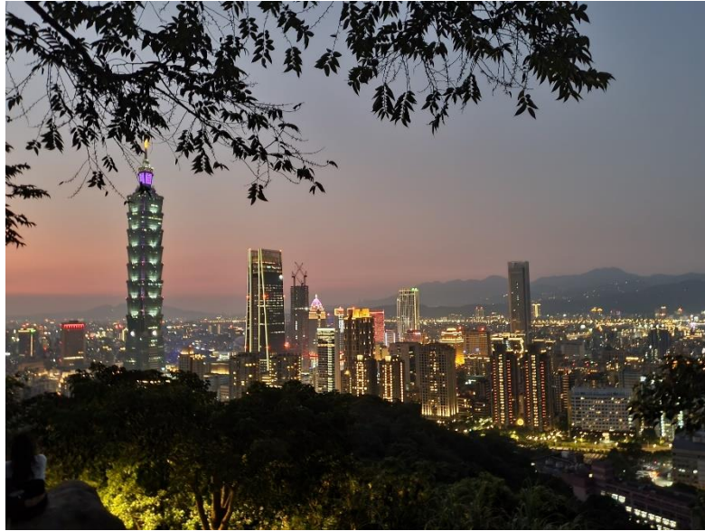
Ausblick von Elephant Mountain